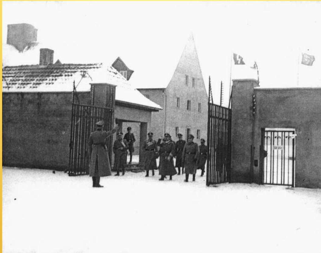
Eingang des KZ Ravensbrück

Darauf folgen: Gefängnis in Freiburg, Polizeigefängnis in Düsseldorf und Duisburg, Strafgefängnis in Düsseldorf und am 31. Juli 1943 Deportation ins Konzentrationslager Ravensbrück.